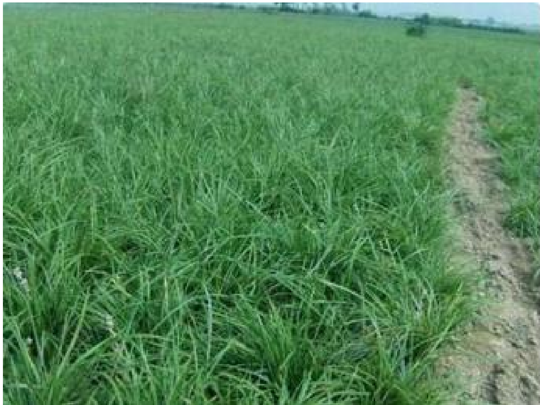
麦冬草的现场照片